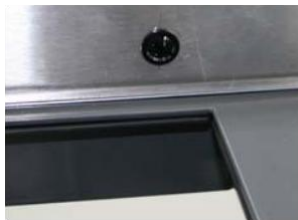
发射端水平安装在转角顶部，向下俯瞰。

2类安全等级，C级性能水准——MicroRay传感器系统由安装在门框顶部的小型发射器和一个安装在地板上，门转角（见下图）的平行接收器构成。它在门关闭期间，可以保护手指不被这个狭窄的危险区域夹到。