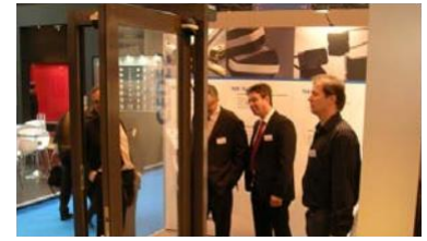
参观者对自动门实例非常感兴趣