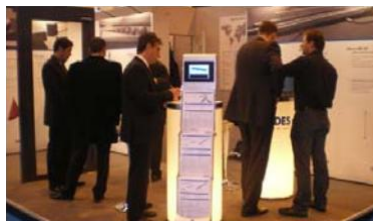
在巴黎门窗交易会上，参观者正在了解CEDES的产品

他说，参观者对于展示在CEDES展台翼门上的这三个传感器的安装便捷程度留下了深刻印象。