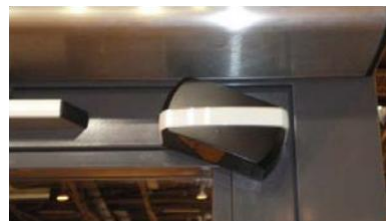
CEDES先进的TOF/TAXI自动门传感器在巴黎首次亮相