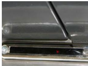
接收器位于安装在地板上的外壳中，外壳极为紧凑。

所有在关门期间进入这个区域的人或者物体，都会被传感器自动探测到，并且系统会重新将门打开。