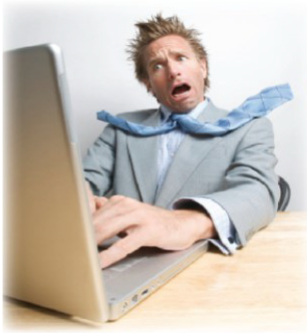
福与祸—爆满的邮箱让我们身心疲惫，深感挫败

另附：从我收发邮件的频率可以看出，我只把 5% 的精力放在邮件沟通上，而其余的 95% 则放在了与同事们面对面的沟通交流上。