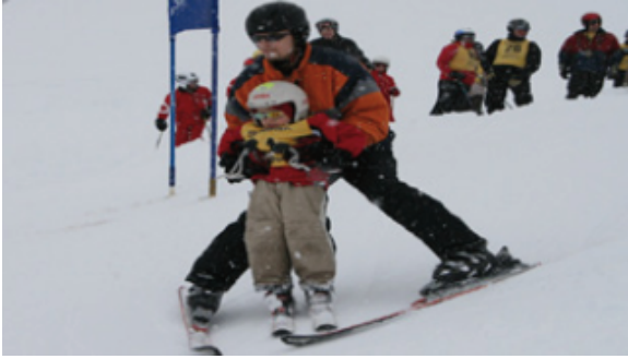
援助之手无处不在