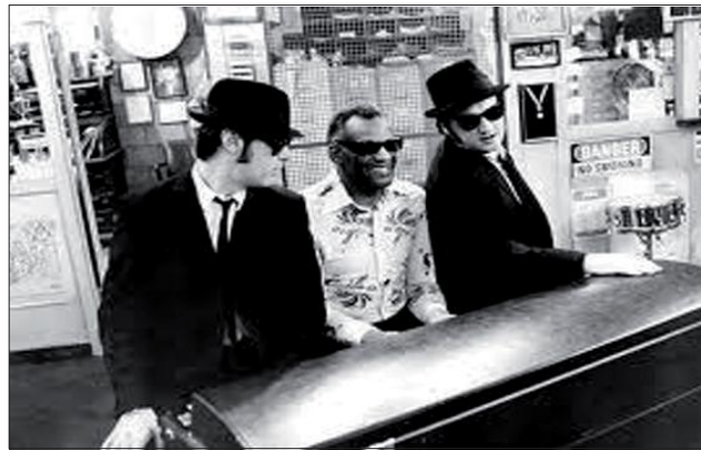
哼哼布鲁斯曲子比你在读报头条时的感觉要好得多

此外，在智利发生的8.8级地震（2010年2月27日，超过500人罹难，12,000人受伤），还有在巴基斯坦发生的大洪水，以及在日本发生了引起海啸的地震已经严重危及到了核电站。这份灾难表无止无尽。我猜想，自从千禧年之后，自然灾害和人为灾难都急剧增加了。到底是怎么回事呢？